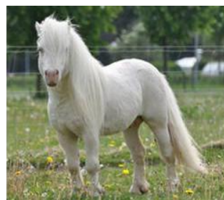
Zilversmokeybont als veulen